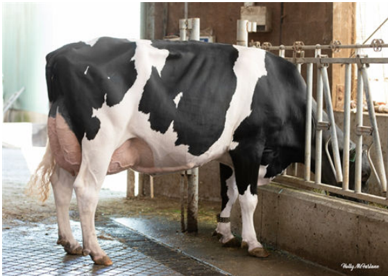
PROGENESIS YODA PALOMA DAM